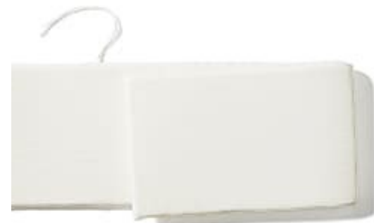
やわらかワッフル

*「掛け布団カバー」、「パイルフィットシート・防水シート(2点セット)」は単品販売も行なっています。