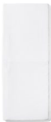
パイルフィット シーツ 1枚