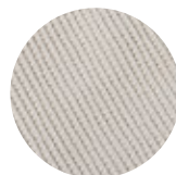
やわらか ワッフル